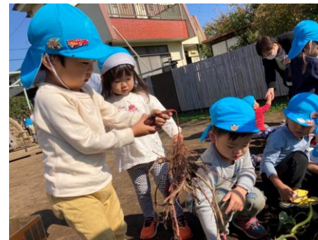
見てー 根っこ長いよー