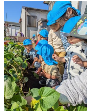
おいも、あるかなー