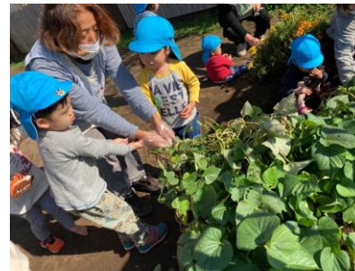
うんとこしょ どっこいしょ