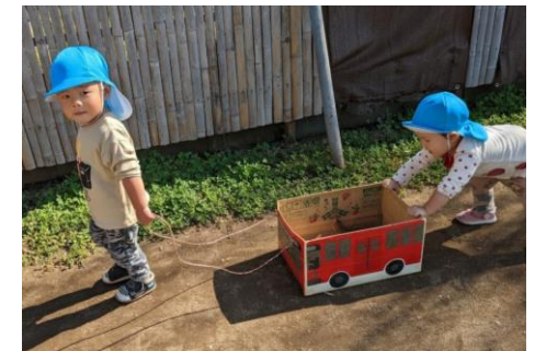
おいもを載せて がったんごっとな